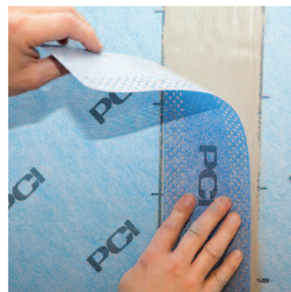
PCI Pecitape 100 P Band monteras över skarven i våtrumssystem VG2013