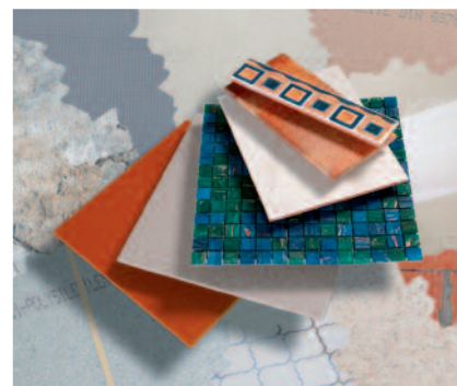
PCI Nanolight är ett smidigt allroundfix för alla typer av underlag och keramiska plattor efter rätt förbehandling av underlaget.