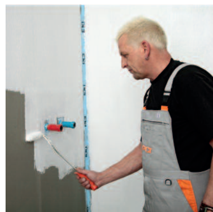
Rör om PCI Lastogum ordentligt innan användning. PCI Lastogum påförs med roller eller pensel.