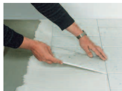
PCI Carraflex för säker läggning av natursten och marmor.