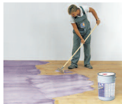
PCI Gisogrund 404 med violett kontrollfärg möjliggör hög vidhäftningsstyrka för avjämningsmassor och plattor på olika underlag.