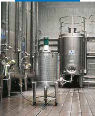
Exempel med fogat golv i en vinkällare