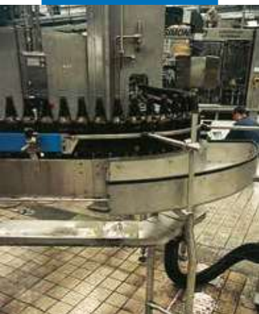
Exempel med fogat golv i ett bryggeri