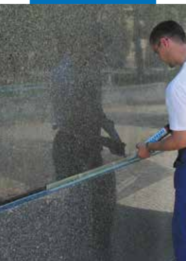
Fogning av fasad med Mapesil LM