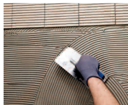
PCI Flexmörtel S1 Rapid, särskilt lämpligt för arbeten med tidspress.